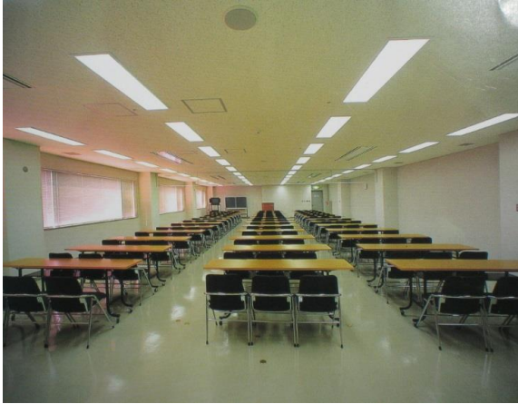
【写真1】大会議室 3人掛け