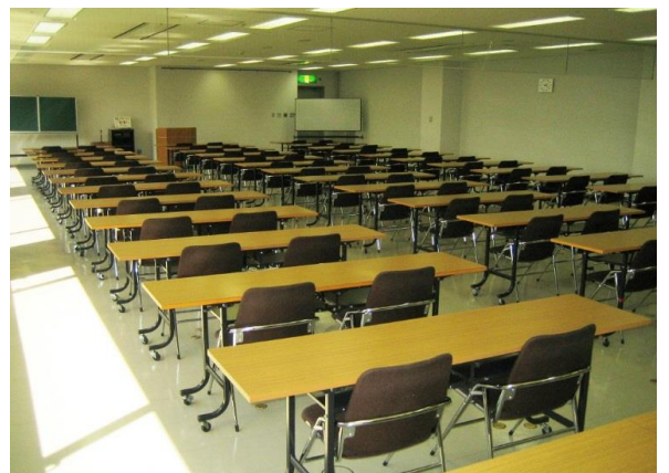
【写真2】大会議室 2人掛け